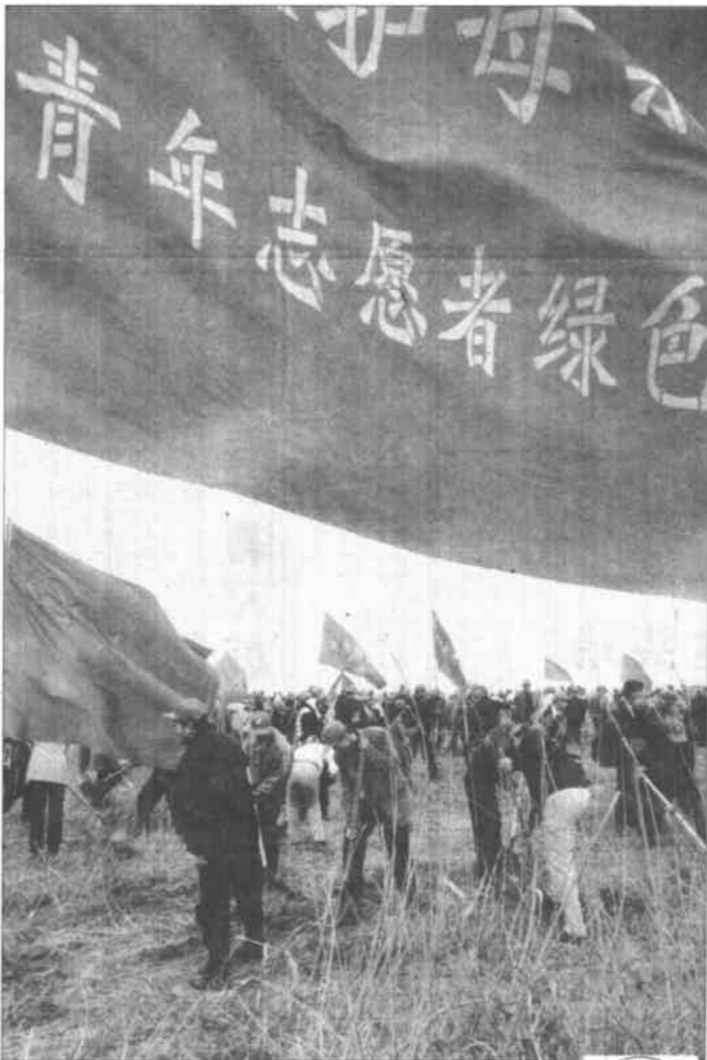
来自全省的1200名青年志愿者参加了黄河三角洲万亩青年生态林工程启动仪式,并在黄河三角洲这片共和国最年轻的土地上播洒青春的汗水和绿色的希望,谱刻下一座齐鲁青年心系黄河、保护黄河的时代丰碑。

崔波在启动仪式上热情洋溢地说,“保护母亲河行动”就是要广泛发动青少年及社会各界力量,以社会化和工程化方式,在哺育中华民族的母亲河——黄河及长江等主要江河流域植树造林,治理水土流失;在全社会大力宣传和倡导绿色文明意识、生态环境意识、可持续发展意识,为母亲河