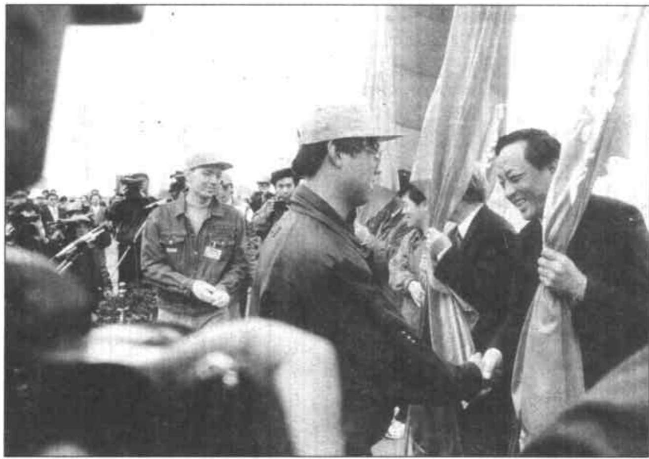
在“保护母亲河、绿化三角洲”黄河三角洲万亩青年生态林工程启动仪式上,朱正昌、崔波、李殿魁、石军分别为来自全省的青年志愿者代表授旗。

本报4月9日讯 今天,地处黄河入海口的垦利县大汶流草场一改往日的平静,彩旗飘扬,人头攒动。我省“保护母亲河绿色工程——黄河三角洲万亩青年生态林”启动仪式在这里隆重举行。省委常委朱正昌,共青团中央书记处书记崔波,省政协副主席李殿魁,共青团中央青农部部长王晓东,市委副书记、市长石军,省林业厅厅长蔡秋芳出席。团省委书记李群主持了仪式。市领导李永健、张万湖、赵芳清、韩宝光、张传堂、杨志良,胜利石油管理局领导黄敏、王立新,东营军分区司令员郑全德,石油大学副校长孙起瑞等参加了启动仪式。